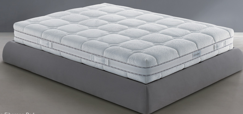
Versione con Fodera Fibersan Pad

Sintesi perfetta di sostegno, elasticità, accoglienza e traspirazione, questo materasso a molle indipendenti di nuova tecnologia Dorelan è in grado di assicurare al tuo corpo un riposo sano e duraturo senza rinunciare ad un comfort sempre piacevole!